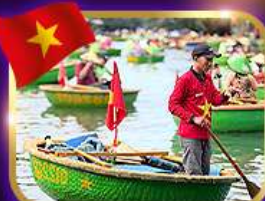
เรือกระด้ง หมู่บ้านก๊อบกาน