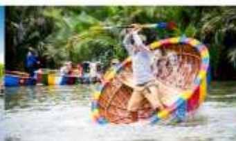
ล่องเรือกระดิ่ง