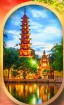
วัดอินทิวร