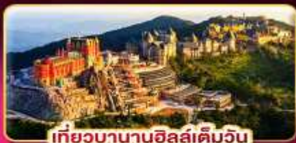
เที่ยวบานาฮิลล์เต็มวัน

ล่องกระทงขามดำคืนที่ฮอยอัน ไฟล์ทสวย บินเช้า-กลับเย็น