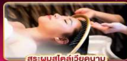
สระผมสไตล์เวียดนาม