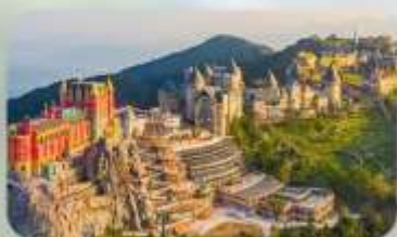
เที่ยวบานาฮิลล์เต็มวัน

TTC HOI AN HOTEL หรือเทียบเท่ามาตรฐานเวียดนาม