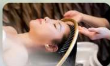
สระผสมสโตร์เวียดนาม