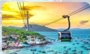
Hon Thom Island