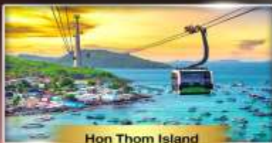
Hon Thom Island