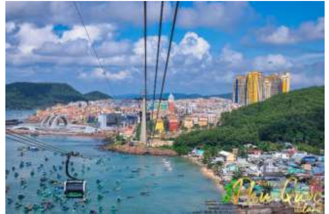
Sun World Hon Thom Nature Park พบกับ

เดียวของเวียดนาม (สำหรับท่านที่สนใจเล่นสวนน้ำ กรุณาเตรียมชุดสำหรับเล่นน้ำ 1 ชุด)