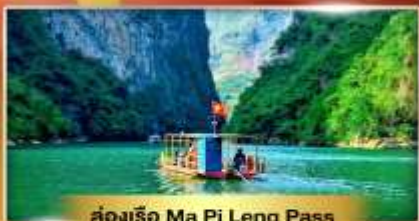
ส่องเรือ Ma Pi Leng Pass

เส้นทางเปิดใหม่ ซาฮายาง เช็คอินเมืองตามด้าว "เวียดนามฟีลยุโรป"