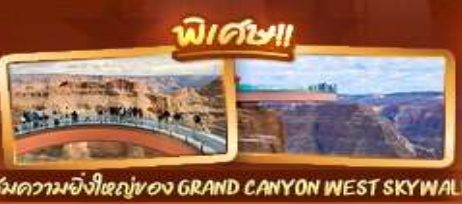
ชมความยิ่งใหญ่ของ GRAND CANYON WEST SKYWALK

เดินทาง 6-14 มี.ค.69 / 20-28 มี.ค.69 3-11 เม.ย.69 / 10-18 เม.ย.69 1-9 พ.ค.69 / 29 พ.ค.- 6 มิ.ย.69