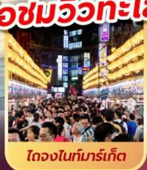
ไถจงไนท์มาร์เก็ต