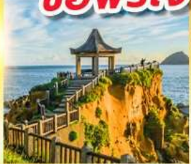
เกาะเหอผิง

พักย่านซีเหมินติง 2 คืน ขอพรเจ้าแม่กวนอิมพันมือ