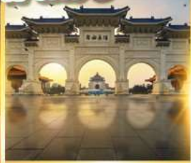
อนุสรณ์เจียงโคเชก