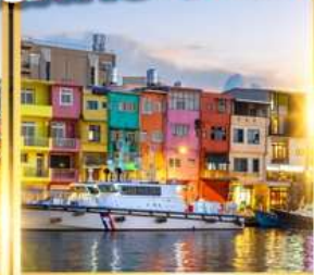
ท่าเรือประมงเจิ้งปิง