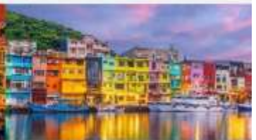
หมู่บ้านชาวประมงหลากสี

*ทางบริษัทฯ ขอสงวนสิทธิ์ในการสลับโปรแกรมทัวร์ตามความเหมาะสมขึ้นอยู่กับสถานการณ์หน้างาน โดยคำนึงถึงผลประโยชน์ของลูกค้าเป็นสำคัญ