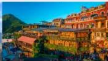
ถนนโบราณจิวเฟิ่น