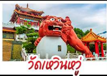
วัดเหวินหู

อาลีซาน - ทะเลสาบสุริยอันจินตรา -ไทเป101 วัดเหวินหู - อนุสรณ์สถานเจียง ไคเชก วัดหลงซาน - ตลาดกลางคืนซีเหมินติง เบบู่ หม้อนึ่งจักรพรรดิ - เขียวหลงเป่า - ชาบูไต้หวัน