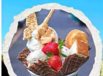
ร้าน ไอศกรีมมิยาฮาระ