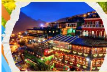
หมู่บ้านโบราณฉิวเฟิง