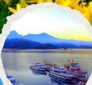
ทะเลสาบสุริยขึ้นฉิงทารา