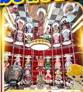
POPMART ซีเหมินตง