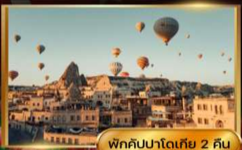
พิกคิปปาโดเกีย 2 คืน