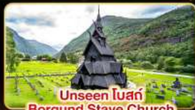
Unseen ในสัก Borgund Stave Church