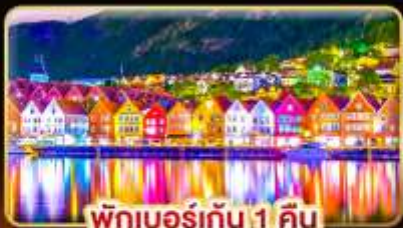
พักเบอร์เกน 1 คืน