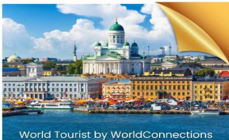
World Tourist by WorldConnections