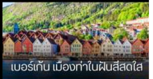
เบอร์เก็น เมืองท่าในฟินส์สไต