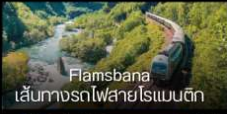
Flamsbana เส้นทางรถไฟสายโรแมนติก