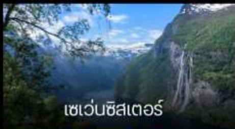
เซเว่นซิสเตอร์