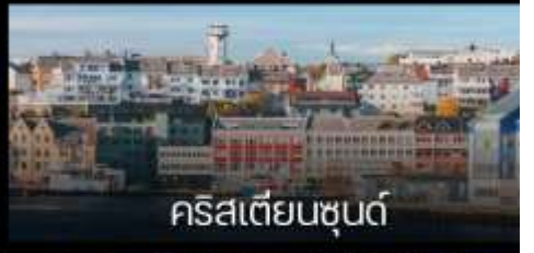
คริสเตียนซุนด์