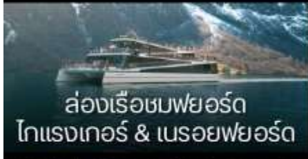
ล่องเรือชมฟยอร์ด โทแรงเกอร์ & นเรอยฟยอร์ด