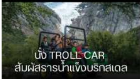
นั่ง TROLL CAR สัมผัสธารน้ำแข็งบรีกสเด