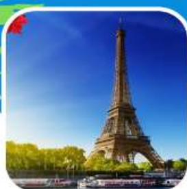
อาหารพิเศษเมนู พื้นเมือง