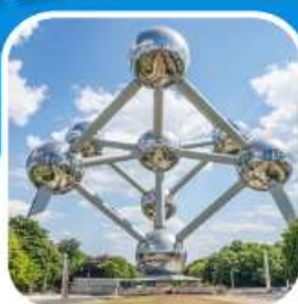
ช้อปปิ้ง มหานครปารีส

ล่องเรือชมแม่น้ำโรนน์ เมือง เซนต์กอร์ - บ็อบพาร์ด ชมเมือง โคโลญน์ มหาวิหารโคโลญน์ เที่ยวเมือง กิ์รฐุน ล่องเรือ ชมหมู่บ้าน ชมเมืองโวเลนดัม ซานสคัน อัมเตอร์ดัม เมืองหลวง เนเธอร์แลนด์ ล่องเรือหลังคากระฉก ชมสถาบันเพชร ล่องเรือชมเมืองบรูจจ์ บรัสเซลส์ ชมอะตอมเมียม ชมเมืองเก่า เข้าสู่ปารีส เข้าพระราชวังแวร์ซายย์ อิสระช้อปปิ้ง ล่องเรือแม่น้ำแซนส์