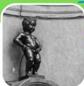
โรงแรมที่พัก 4 ดาว