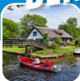
ท่องเที่ยวครบ ตลอดการเดินทาง