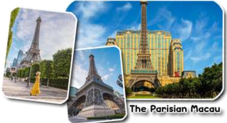
The Parisian Macau

และนำท่านชม The Parisian Macao (เดอะปารีสเซียน มาเก๊า) เป็นอีกหนึ่งแลนด์มาร์คของมาเก๊าที่ได้ยกหอไอเฟลมาจำลองใจกลางเมือง Cotai Strip โรงแรมแห่งนี้ได้รับแรงบันดาลใจมาจากเมืองปารีส ประเทศฝรั่งเศส นครแห่งศิลปะที่มีความงดงามทางด้านสถาปัตยกรรม ความโดดเด่นของหอไอเฟลกลิ่นอายของความคลาสสิกและความโรแมนติกมาไว้ที่โรงแรมแห่งนี้