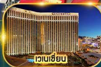
เวเนเซียน