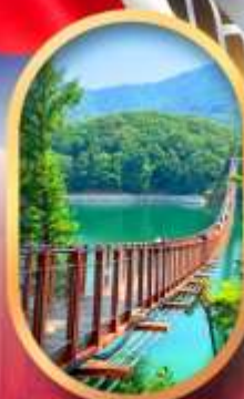
สะพานแขวนมาจิง