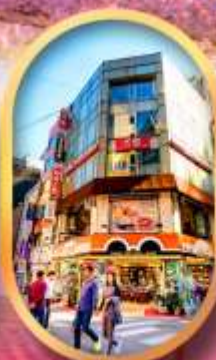
ช้อปปิ้งย่านเมืองคอง