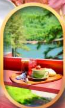
คาเฟ่ลับกลางป่า