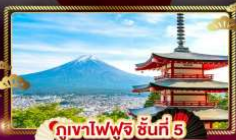
ภูเขาไฟฟูจิ ชั้นที่ 5

ชมลาวนเดอร์ ที่ สวนไอชิปาร์ค อิสระ 1 DAY TRIP