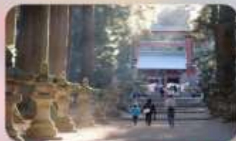
ศาลเจ้าคิระกูจิฮอนกุ ฟูจิ เซ็นเกิน