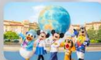
อิสระ-ตามอัธยาศัย 1 วัน