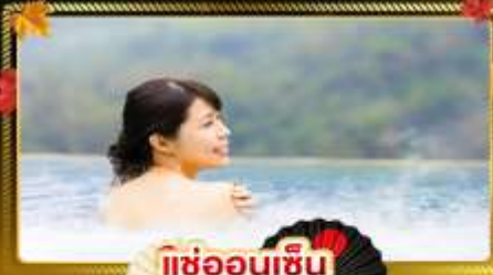
แช่ออนเซ็น