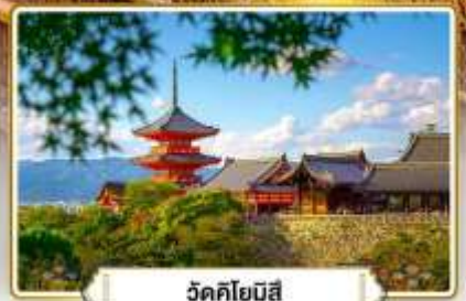
วัดคิโยมิตสึ