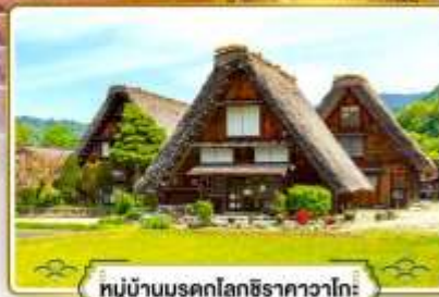
หมู่บ้านมรดกโลกชิราคาวาโกะ

✔ ช้อปบิงย่านฮิตที่สุดในโอซาก้า "ชินโซบาชิ"