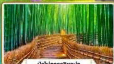
ป่าไม้อาราชิม่า

มัทสึจิมะ เกียวโต ชิราคาวาโกะ ทาคายาม่า | 5 วัน 3 คืน