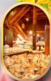
พิพิธภัณฑ์ถ้ำออนเซ็น