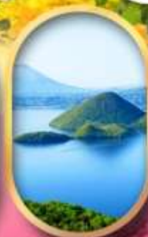
วิวทะเลสาบโทโยะ