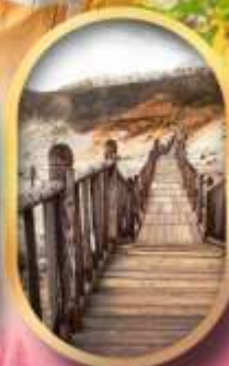
หุบเขาจิทอกุคาบิ