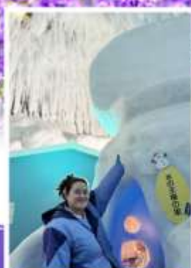
พิพิธภัณฑ์น้ำแข็ง