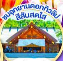
ชมอุทยานดอกทิวลิป สุสันสคไซ