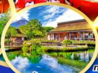
หมู่บ้านน้ำใสโอชิโนะฮักโกะ