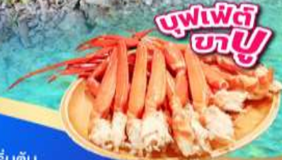
บุฟเฟ่ต์ ขาปู