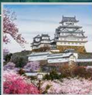
"HIMEJI CASTLE PARK"