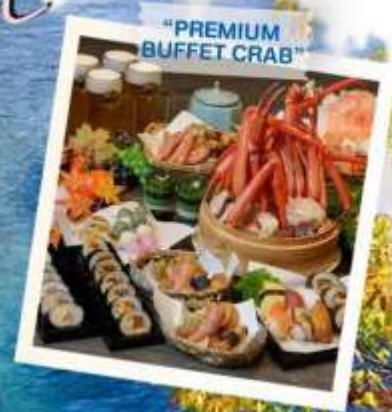
"PREMIUM BUFFET CRAB"