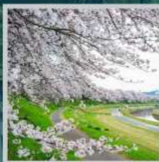
"OKAYAMA SAKURA CARNIVAL"