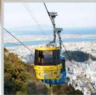
"MT. BIZAN ROPEWAY"