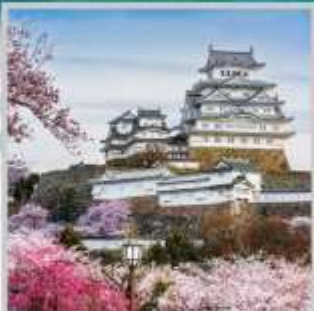
"HIMEJI CASTLE PARK"