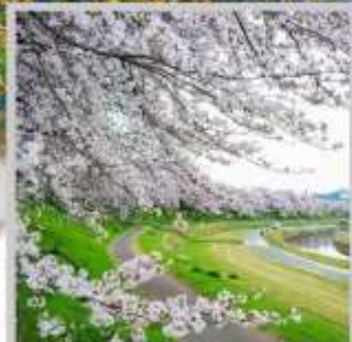
"OKAYAMA SAKURA CARNIVAL"