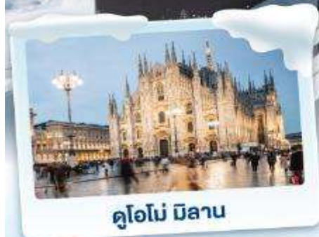
คูโอโม มิลาน