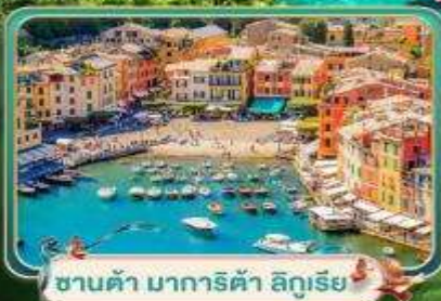
ซานต้า มาการิต้า ลิกูเรีย