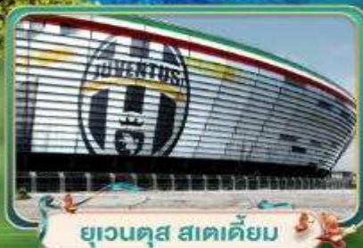
ยูเวนตุส สเตเดียม

เที่ยวฟรีไป! หมู่บ้านตากอากาศสุดไฮโซ ณ ชายฝั่งริเวียร่า