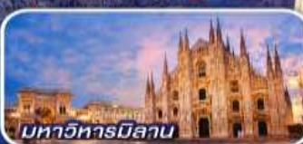
มหาวิหารมิลาน