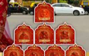
พระพิฆเนศ 8 องค์ เมืองปูणे