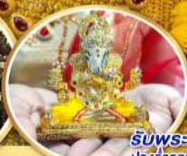
รับพระพิฆเนศวร ปางรำรอยท่านละ 1 องค์