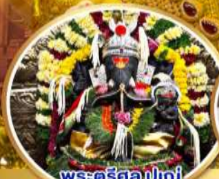
พระตรีศูล ปูणे (Trishul Pune)