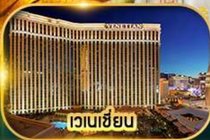
เวเนเซียน