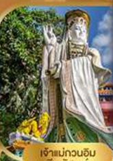
เจ้าแม่กวนอิม รับพลบชัย