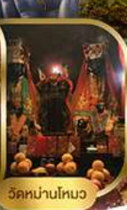
วัดหนานโหวง