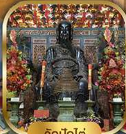
วัดปึกใต้