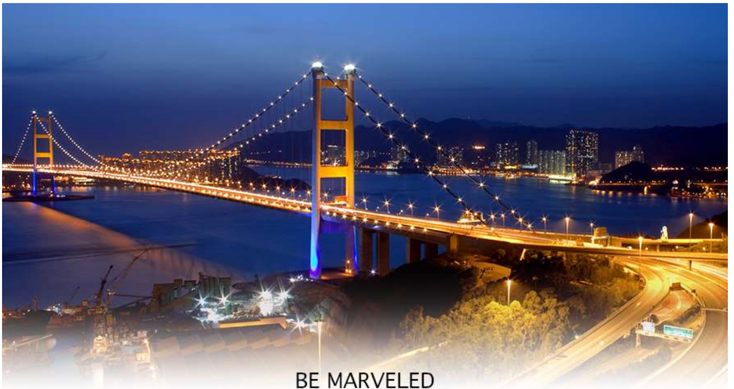
BE MARVELED สะพานแขวนฉิวหม่า