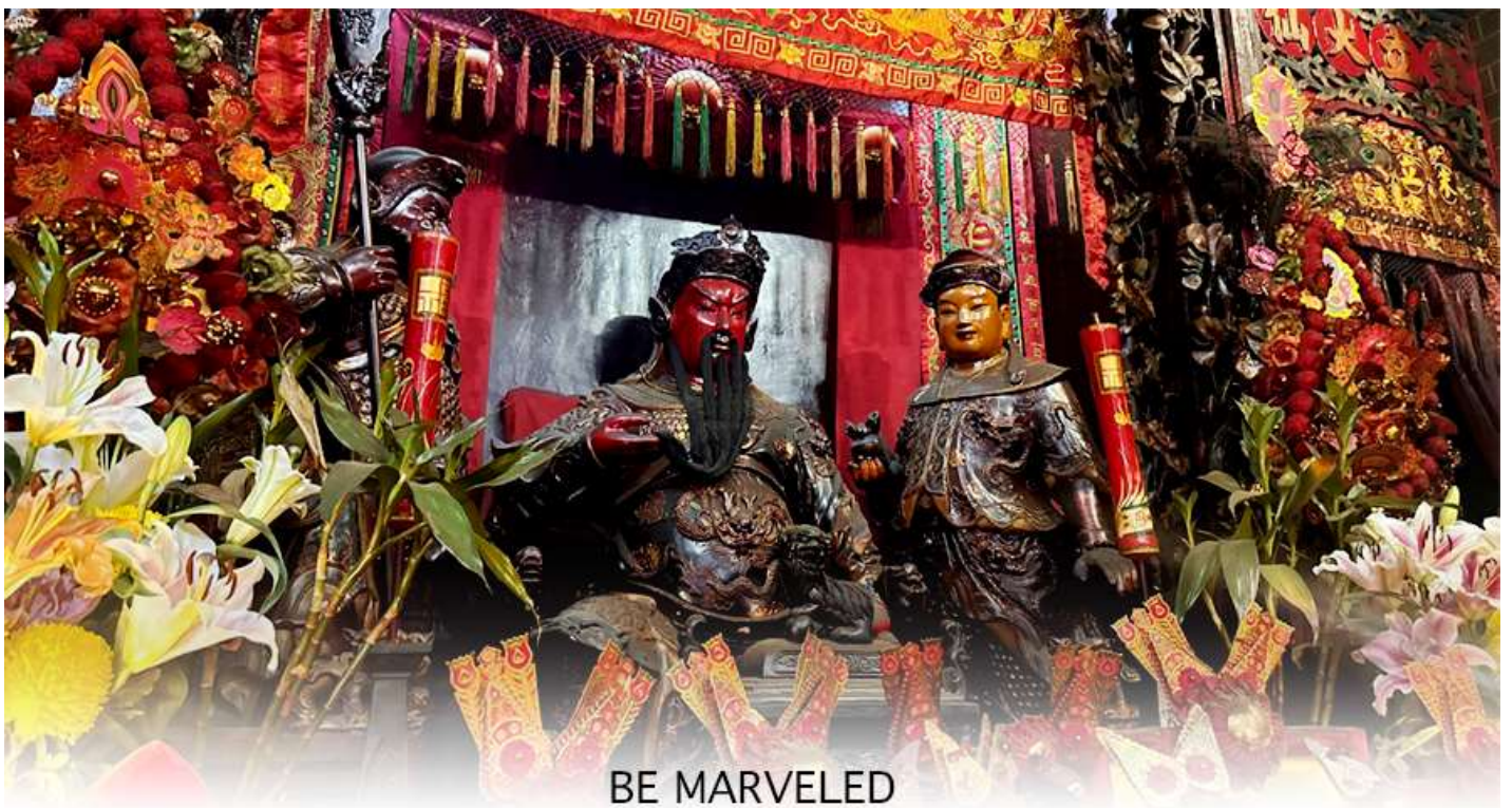
BE MARVELED วัดกวนอู

เจ้าแม่ทับทิม หรือ เทพธิดาแห่งท้องทะเล ซึ่งทำหน้าที่ปกป้องคุ้มครองชาวประมง ตั้งโดดเด่นอยู่ท่ามกลางสวนสวยที่ทอดยาวลงสู่ชายหาดให้ท่านนมัสการขอ และนำท่านเดินข้าม สะพานต่ออายุ ซึ่งเชื่อกันว่าข้ามหนึ่งครั้งจะมีอายุเพิ่มขึ้น 3 ถ้าข้ามแล้วห้ามเดินย้อนกลับไปเด็ดขาด เพราะคนฮ่องกงเชื่อว่าชีวิตจะสั้นลงไป 3 ปี สำหรับคนโสดจะนิยมขอพรกับ เทพเจ้าแห่งความรัก ให้เอามือลูบที่บริเวณหินสีดำ พร้อมกับอธิษฐานให้สมหวังกับความรัก ปิดท้ายด้วยการรับพลังฮวงจุ้ยจาก ศาลา แปะทิส ซึ่งถือเป็นจุดรวมรับพลัง ถือเป็นจุดที่มีฮวงจุ้ยดีที่สุดในเกาะฮ่องกง และยังมีรูปปั้นองค์เทพอีกมากมายภายในวัดแห่งนี้ให้กราบไหว้ขอพร