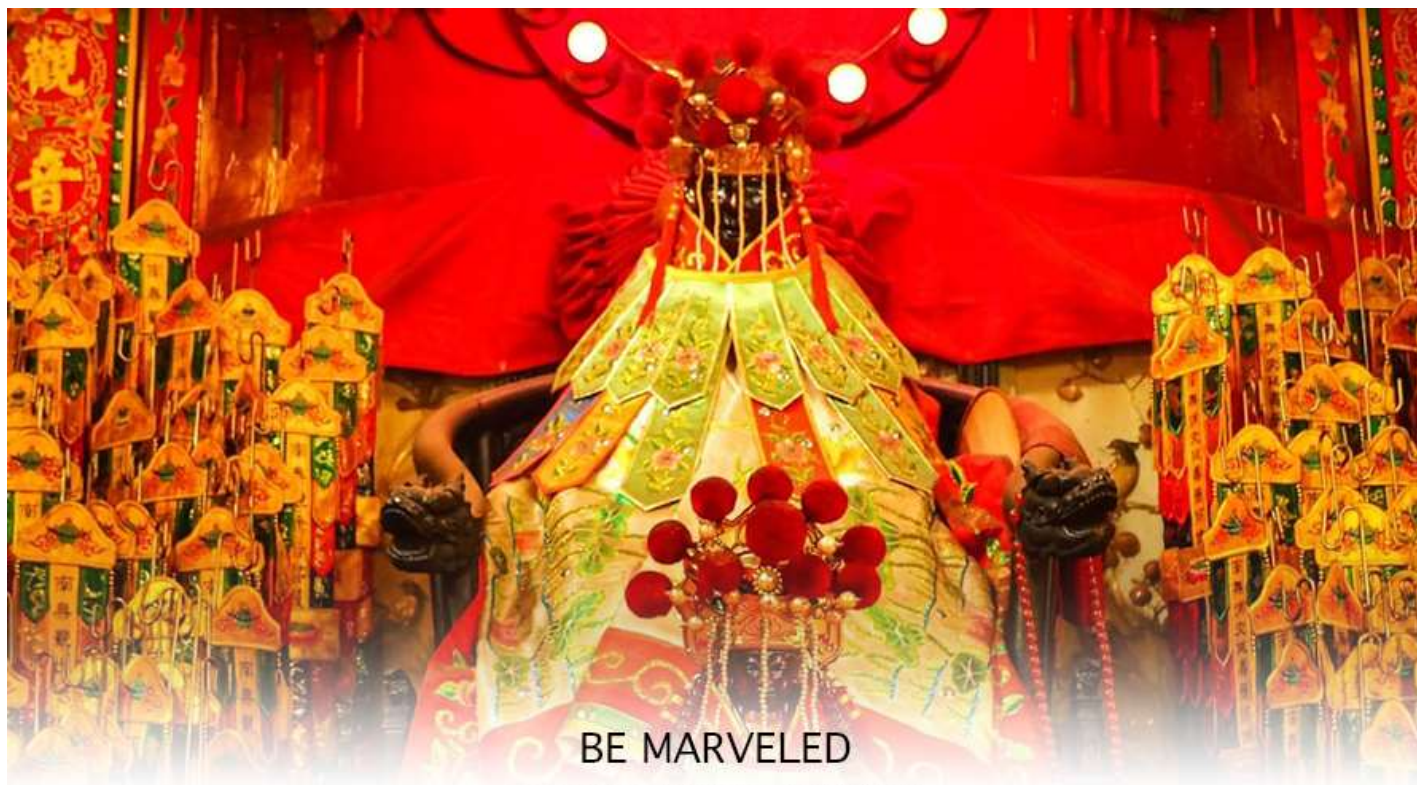
วัดเจ้าแม่กวนอิมฮองฮ่า (ยิมเงิน)

ฉะนั้นการมาบูชาขอพรท่าน จะช่วยเสริมดวงไม่ให้เพลิงพลั่วแก่ศัตรู ทำให้มีมิตรที่ซื่อสัตย์ และคุ้มครองบริวารให้ก้าวหน้า และอยู่เย็นเป็นสุข ซึ่งผู้ประกอบอาชีพ ตำรวจ ทหาร และ นักการเมือง จึงมักจะนิยมบูชาเทพเจ้ากวนอู เป็นพิเศษ