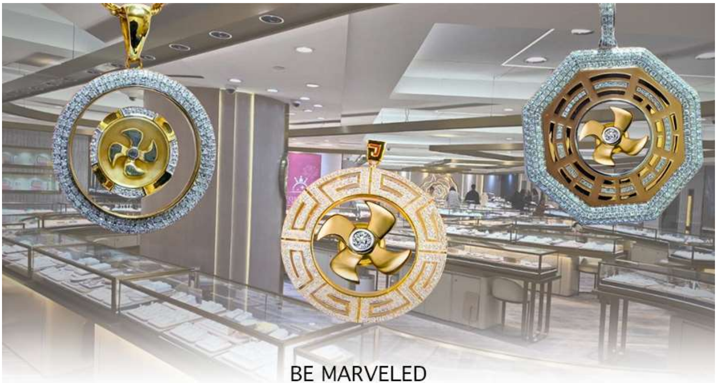
BE MARVELED ศูนย์ฮวงจุ้ย กังหันเศรษฐี

นำท่านชม ศูนย์ฮวงจุ้ย กังหันเศรษฐี ที่ขึ้นชื่อของฮ่องกง ท่านจะได้พบกับงานดีไซน์ที่ได้รับรางวัลยอดเยี่ยม และใช้ในการเสริมดวงเรื่องฮวงจุ้ย โดยการย่อใบพัดของกังหันที่เป็นสัญลักษณ์ของวัตต์แดงหงมิว มาทำเป็นเครื่องประดับ ไม่ว่าจะเป็นจี้, แหวน, กำไล หรือต่างหูเพื่อเป็นเครื่องประดับติดตัว และเสริมดวงชะตา ซึ่งสินค้าทุกชิ้นนี้ มีเอกสาร รับประกันคุณภาพเปลี่ยนหรือ ซ่อม ได้ตลอดอายุการใช้งาน หากเกิดการชำรุดจากสินค้าไม่ใช่อุบัติเหตุ