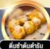
คัสซาดัมตำรับ

гариди! 4 คาว THE KOWLOON HOTEL ติดถนนบาราณ ย่านช้อปปิ้งจิมซาจอย