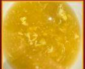
ซุ๊ปข้าวโพด