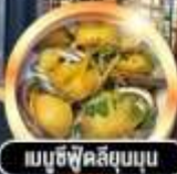
เมมูซี่ฟูดส์ลุ่มนุ่ม