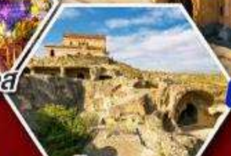
เมืองถ้ำอพลิสต์ซิคห์

แพคเกจ Rooms Hotel โรงแรมวิวทิวทัศน์ของเทือกเขาคอเคซัส