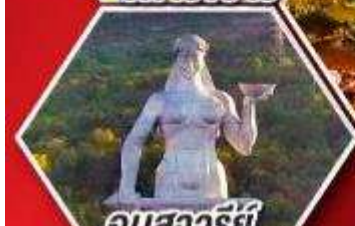
อนสาวรีย์ มารดาแห่งจอร์เจีย