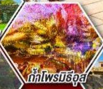
ถ้ำไฟโรบิธอส