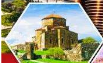
วิหารจวารี