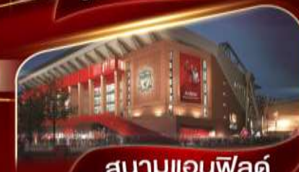
สนามแอนฟิลด์