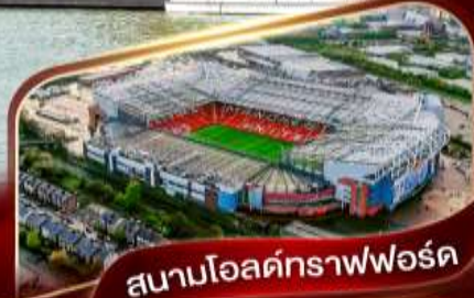
สนามโอลด์แทรฟฟอร์ด