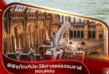
พิพิธภัณฑ์ประวัติศาสตร์ธรรมชาติ ลอนดอน