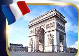
ประตูชัยอาร์กเดอทรียัมป์