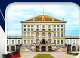
พระราชวังนิมเฟนบวร์ก