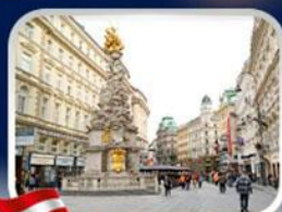
ช้อปปิ้งคาร์ทเนอร์สตรีก