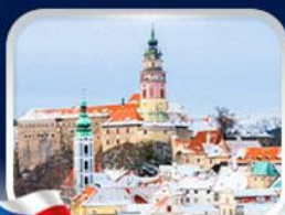
เมืองเชสกี้ กลุมลอฟ