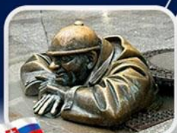
ประติมากรรม Cumil

มาเรียนพลาซซ์•บ้านเกิดโมซาร์ท•พระราชวังฮอฟบวร์ก•ซาลส์บวร์ก•บ้านเกิดโมซาร์ท•เกรโกเดรสตรีก•ทะเลสาบคอนิกซี•หมู่บ้านอัลส์สตัดท์•อนุสาวรีย์มาเรียเทเรซา