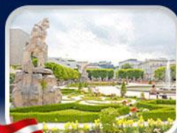
สวนมิราเบล ซาลซ์บวร์ก