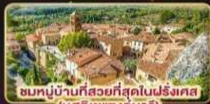
ชมหมู่บ้านที่สวยงามที่สุดในฝรั่งเศส (มูสดีเยแซงกบาร์ท)