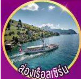
ล่องเรือลูเซิร์น