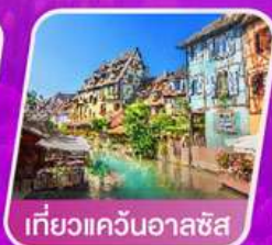
เที่ยวแคว้นออลซัส