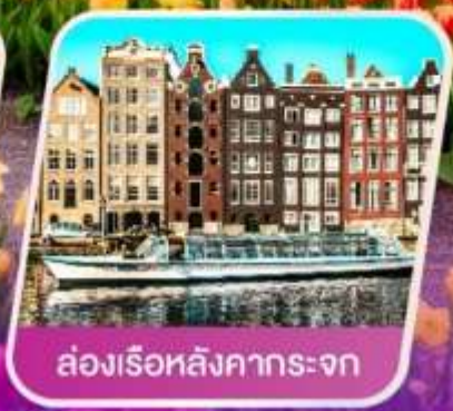
ล่องเรือหลังคากระຈก