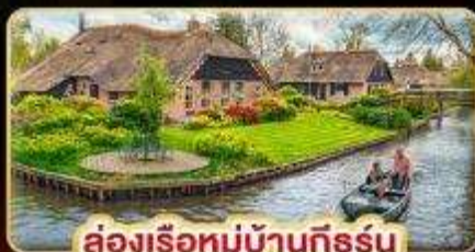
ล่องเรือหมู่บ้านกังธูร์น