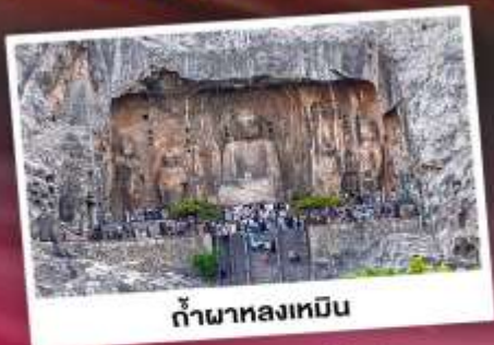
ถ้ำผาหลงเหมิน