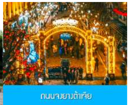
ถนนจงยั้งตู้