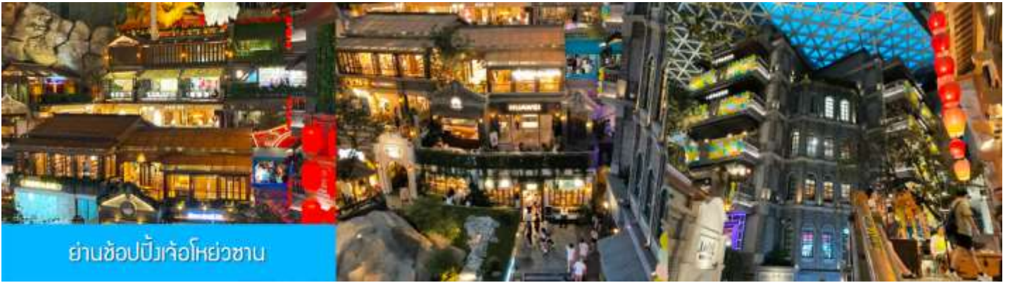
ย่านช้อปปิ้งเก๋โอห่วยซาน

นำท่านเที่ยวชม ย่านช้อปปิ้งเจ้อโอห่วยซาน 这有山 แหล่งช้อปปิ้งจีนชื่อที่ผสมผสานระหว่างสถานที่ท่องเที่ยวและแหล่งรวมร้านค้า และร้านอาหารฟาสต์ฟู้ด อาหารพื้นเมืองร่วมสมัย ภายใต้คอนเซ็ปต์ แหล่งช้อปปิ้งบนภูเขา และบนภูเขามีแหล่งช้อปปิ้ง เป็นจุดเช็คอินยอดนิยมที่เปิดให้คนพื้นที่และนักท่องเที่ยวเข้าชม ตั้งแต่ปี ค.ศ. 2019