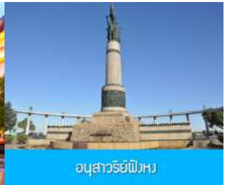
อนุสาวรีย์พิงหวง

หลังอาหารนำท่านชม โบสถ์ เซนต์โซเฟีย 索菲亚教堂 (ชมด้านนอก) อีกหนึ่งสัญลักษณ์ที่โดดเด่นของเมืองฮาร์บิน สร้างขึ้นในปี ค.ศ. 1907 เป็นโบสถ์คริสต์นิกายออร์ทอดอกซ์ ที่ใหญ่ที่สุดในเอเชียตะวันออกเฉียงที่แสดงถึงอิทธิพลของวัฒนธรรมรัสเซียที่มีต่อเมืองฮาร์บิน