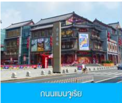
ถนนแมนจูเรีย