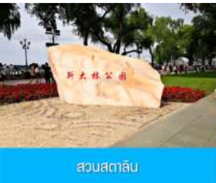
สวนสตาลิน