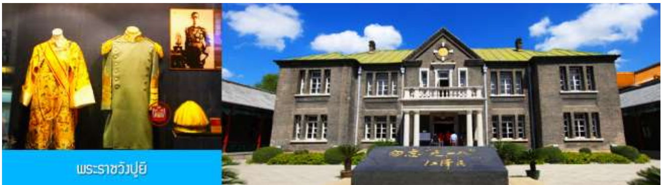
พระราชวังปูยี

รับประทานอาหารเช้า ณ ห้องอาหารของโรงแรม (7)