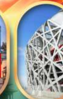
ผ่านชมสนามกีฬาาริงนก