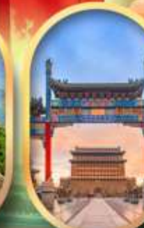
ถนนคนเดินเทียนเหมิน