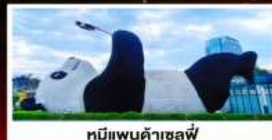
หมีแพนด้าเซลฟี