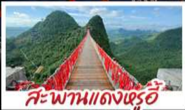
สะพานแดงหรือ