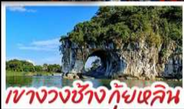
เขางวงช้าง กั๊ยแฉลิน